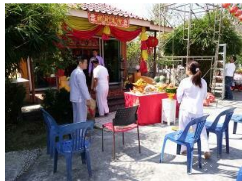
ภาพ ศาลเจ้าพ่อเสือสถานที่ศักดิ์สิทธิ์ในชุมชน