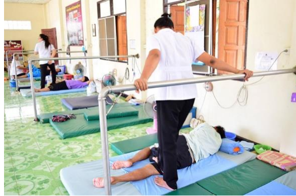
ภาพ สวน เกษตร อินทรีย์ นวัต วิถีล่อม อ้าย